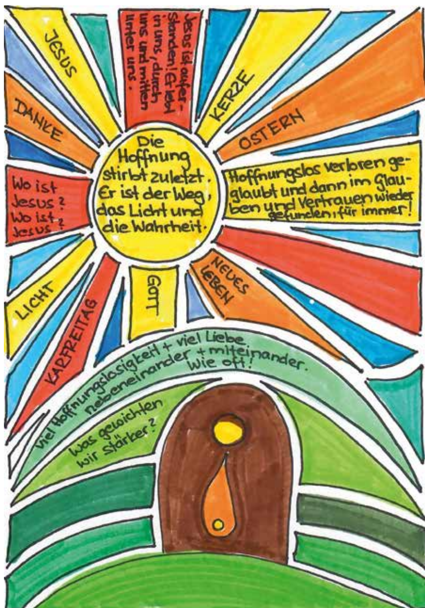
Bildlich-kreative Zusammenfassung der Voten, die notiert worden sind zu den Szenen der Passions- und Ostergeschichte, welche das Figurenteam im Frühjahr mit den biblischen Erzählfiguren dargestellt hatte.