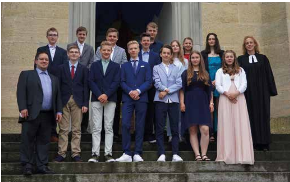
Links: Gruppenbild von der Konfirmation am 6. Juni – mit Kerzen